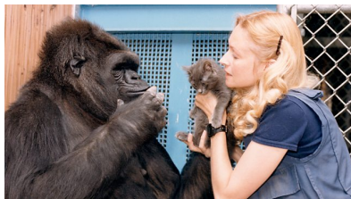
Коко [Patterson, Linden 1981]