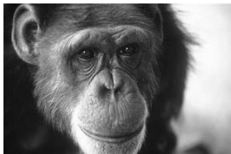
Уошо [Gardner, Gardner 1969]